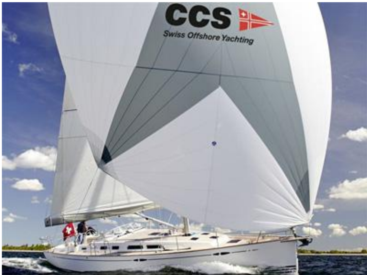
SY DREAMING SWISS (XC 42)