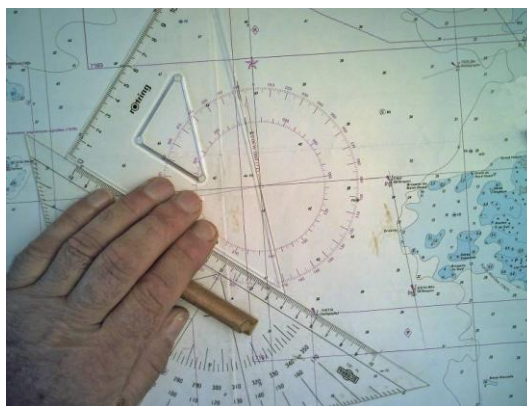
Parallelverschiebung/Kursmessung (mwK und/oder KüG)